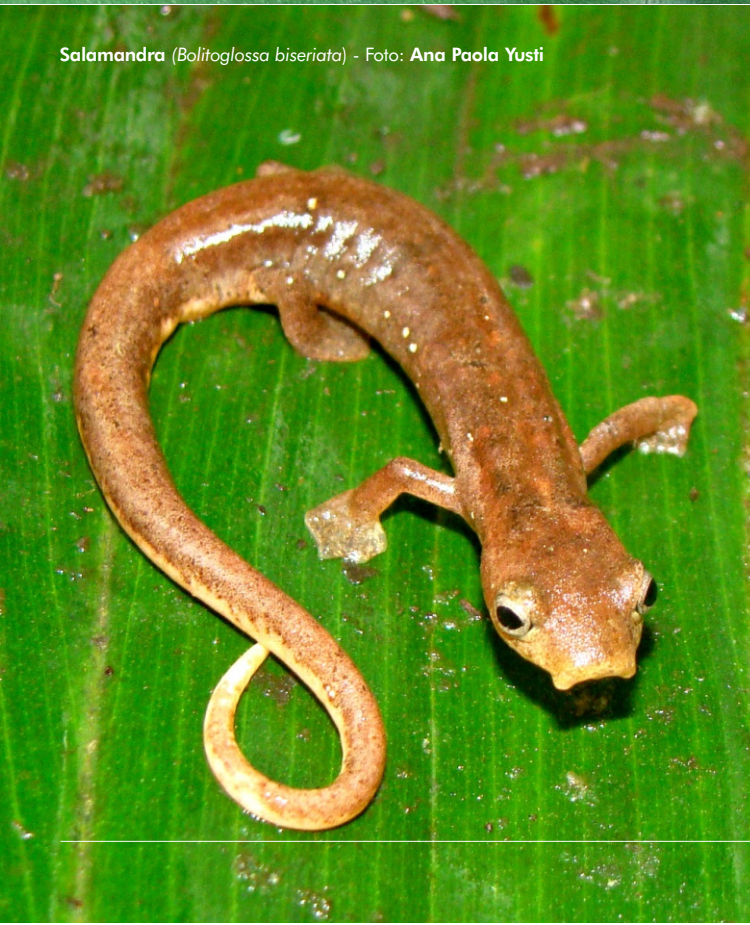
Salamandra ( Bolitoglossa biseriata )