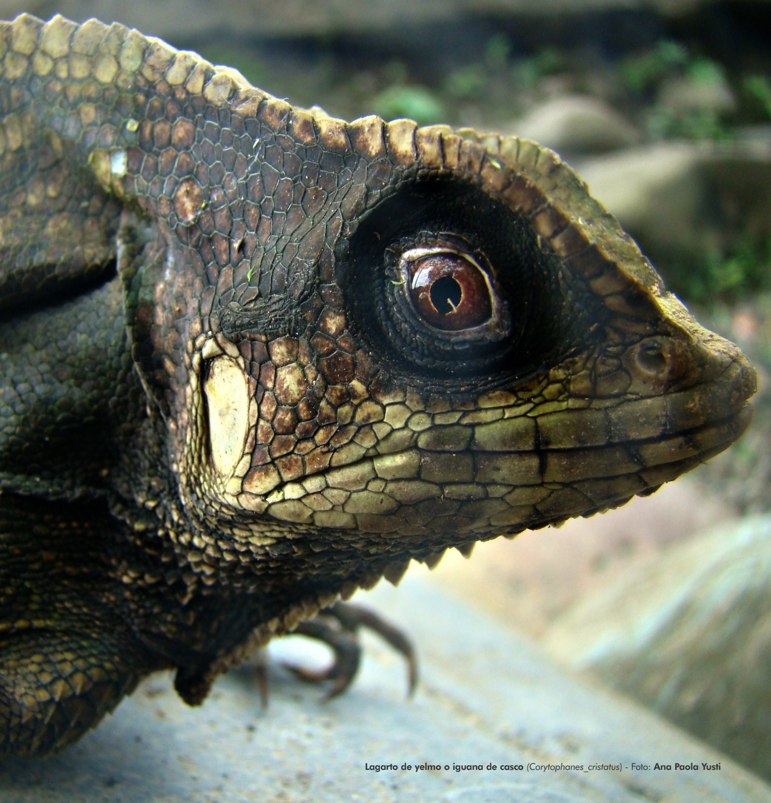
Lagarto de yelmo o iguana de casco ( Corytophanes cristatus )