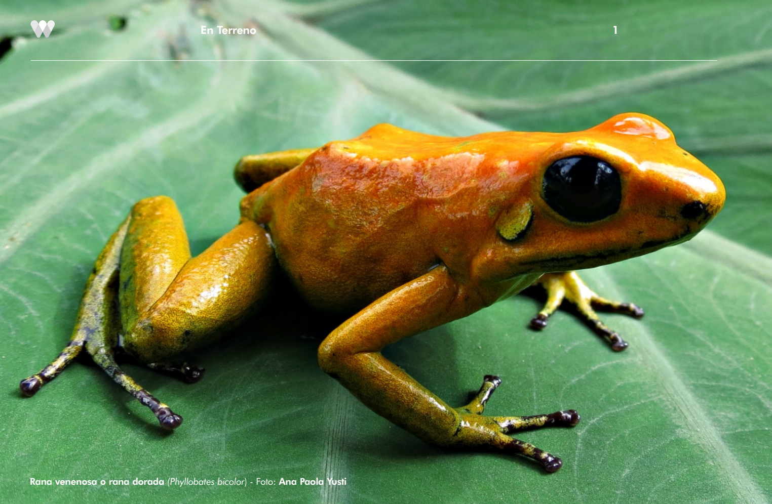
Rana venenosa o rana dorada ( Phylllobates bicolor )