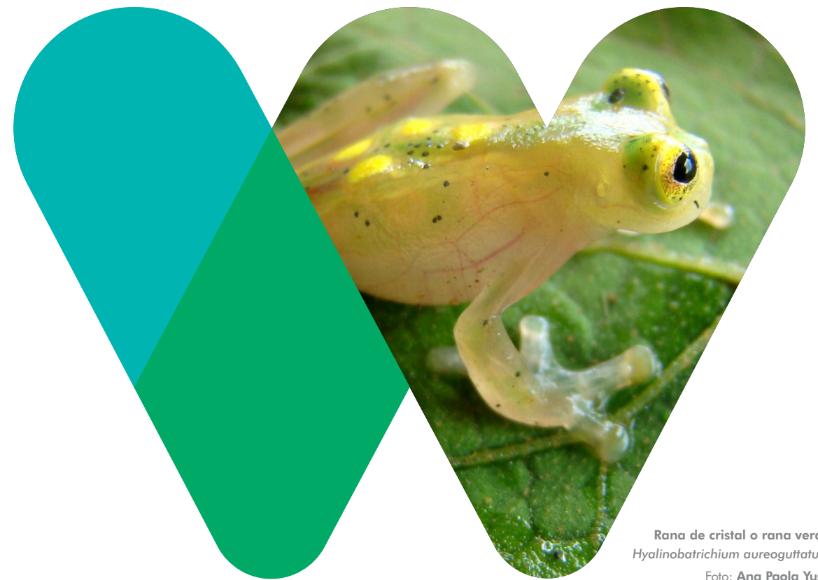
Rana de cristal o rana verde Hyalinobatrachium aureoguttatum

Boletín divulgativo de WCS Colombia - Mayo de 2016 - No. 4