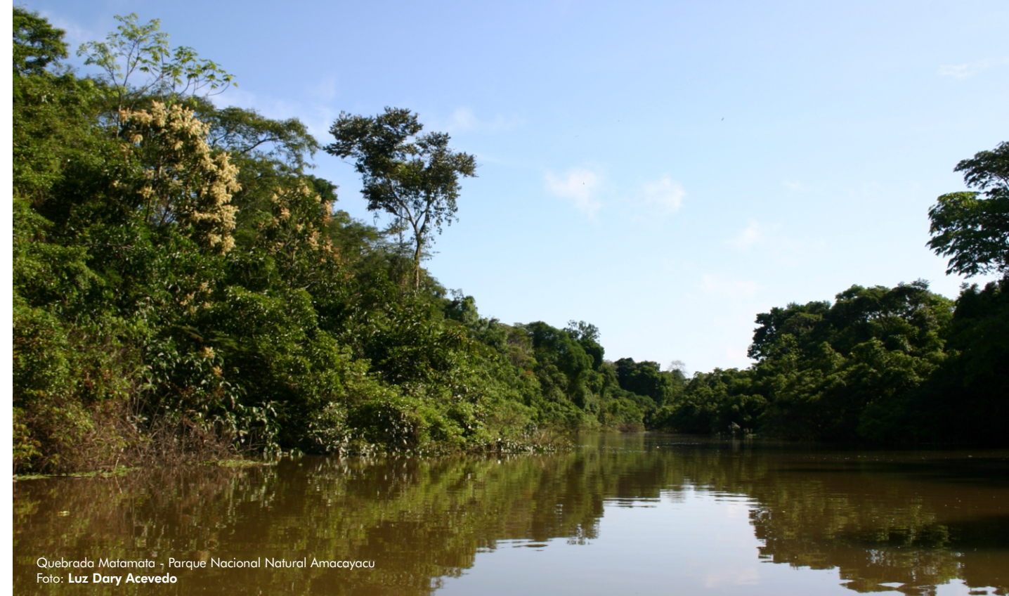
Quebrada Matamata - Parque Nacional Natural Amacayacu

Conozca más del proyecto “ Conservamos la Vida ”, del que WCS Colombia forma parte, en www.conservacionosoandino.org